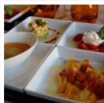
Florença – Restaurante