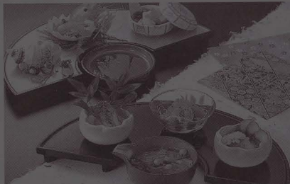
参展的酒店专用行真工艺品

日前，在美国旧金山举行的2009游戏开发者大会上，全球最大的二维、三维数字设计软件公司欧特克公司，率领其强大的